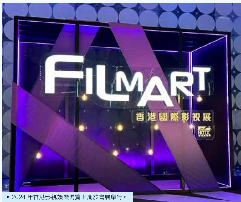
• 2024年香港影視娛樂博覽上展出的FILMART香港國際影視展。

剛在上周落幕的香港國際影視展（FILMART）以及亞洲影視娛樂論壇（EntertainmentPulse）博覽會，是香港特區政府「藝術三月2024」的頭炮活動之一，活動雲集業界領袖及環球展商，展示最新影視作品和科技，分享環球業界議題的同時，大會也開放線上平台推廣IP項目，促進業界拓展國際市場新機遇。