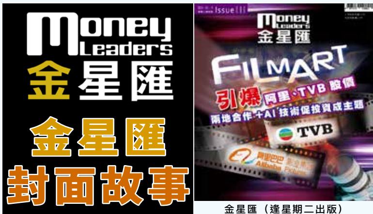
金星匯（逢星期二出版）

香港曾經是全球第三大電影制作中心，經歷百年興衰的香港電影在疫後正呈反彈復甦。由影視界專業團隊打造的全方位娛樂IP孵化平台——CUVE，現推出「娛樂x技術x金融」概念，冀借助A.I.技術，發掘和扶持新晉導演和編劇，進一步推動本港影視業的發展。